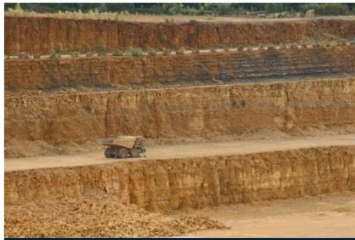
LIME & GYPSUM