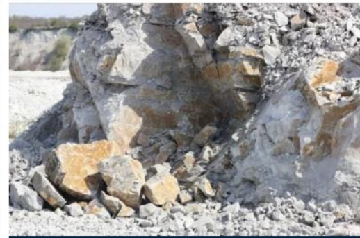
MINING & MINERALS